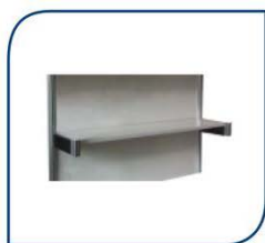
ESTANTERÍA INDIVIDUAL 17,57€