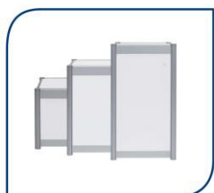
PODIUM 50X50X50 CM 40,00€