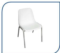
SILLA CARCASA 7,00€

El expositor no está obligado a contratar exclusivamente los productos que ofertamos en esta guía, puede llevar al stand material propio o alquilado con proveedores externos.