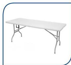
MESA 2.00 X 0.80 M CON MANTEL 58,00€