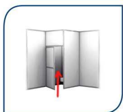
ML DE PUERTA 100,00€