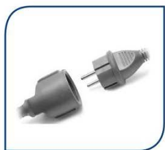
ENCHUFE ADICIONAL 20,00€