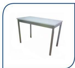
MESA DE 1.00 X 0.50 M 50,00€