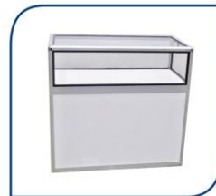
MOSTRADOR VITRINA 80,00€