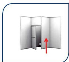
ML DE PANEL 35,00€