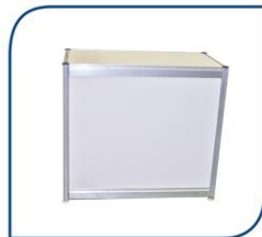
MOSTRADOR MODULAR 75,00€