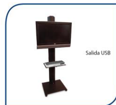
MONITOR DE PLASMA DE 55" 380,00€