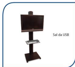
MONITOR DE PLASMA DE 46" 350,00€