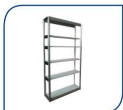
ESTANTERÍA VARIAS BALDAS 85,00€