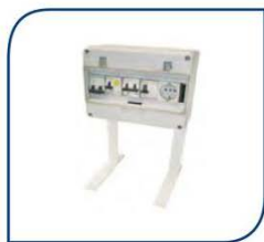
CUADRO ELECTRICO 3kw 230,00€

- Si necesita la contratación de un cuadro eléctrico póngase en contacto con nosotros