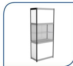
VITRINA 100X50X250 CM 176,00€