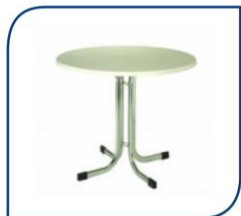
MESA IBIZA 32,00€